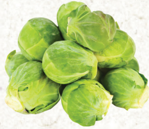
Choux de Bruxelles