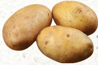
Pommes de terre